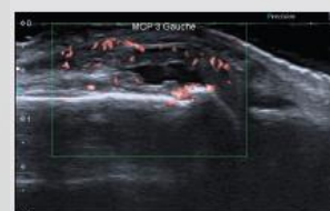
SMI : Superb Microvascular Imaging