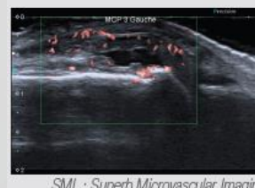
SMI : Superb Microvascular Imaging